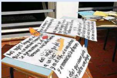
Els alumnes realitzen diferents tasques al llarg del curs, que serveixen per generar materials i recursos relacionats amb el món de la poesia.