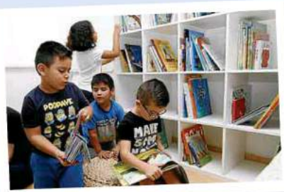
PRIMER, INFANTIL. L'espai s'ha dotat primer amb llibres per als més petits.

cat per impulsar un nou projecte per al foment de la lectura i l'escriptura, el qual parteix de la creació de la biblioteca. Perquè, tot i que fa anys l'escola havia tingut una petita biblioteca, els darrers temps i per culpa de la saturació d'alumnes i la necessitat d'habilitar noves aules (fins i tot, unes quantes de prefabricades), el centre no comptava amb un espai destinat als llibres i el foment de la lectura. «Amb la massificació que hi havia no era possible tenir